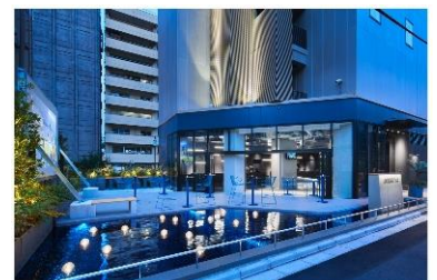
sequence SUIDOBASHI (外観・オープンテラス)