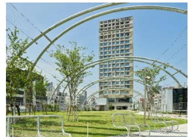
sequence MIYASHITA PARK (外観)

所在地 : 東京都渋谷区神宮前6-20-10 MIYASHITA PARK North 客室数 : 240室