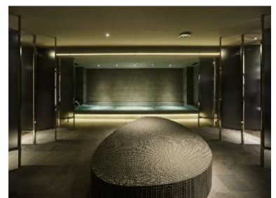
sequence KYOTO GOJO (THE BATH & THE SAUNA)

ブランドサイト: https://www.sequencehotels.com/