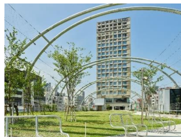
sequence MIYASHITA PARK (外観)

所在地 : 東京都渋谷区神宮前6-20-10 MIYASHITA PARK North 客室数 : 240室