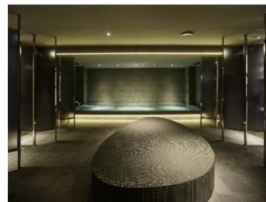
sequence KYOTO GOJO (THE BATH & THE SAUNA)

ブランドサイト: https://www.sequencehotels.com/