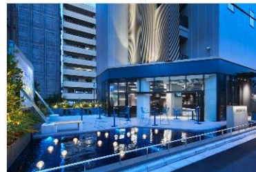
sequence SUIDOBASHI (外観・オープンテラス)